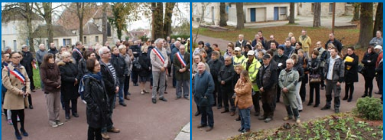
Rassemblement devant la Mairie lors du Deuil national le lundi 16 novembre à midi

Pour qu'ensemble et déterminés, avec la volonté d'être toujours debout, nous résistions face à la barbarie.