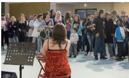
Fête de la musique.

Traditionnellement, les périodes printanières et estivales sont l'occasion pour les Othissois de participer aux nombreuses manifestations associatives, sportives et culturelles, et municipales. Cette année, les animations proposées ont une nouvelle fois ravi petits et grands, venus en grand nombre se divertir :