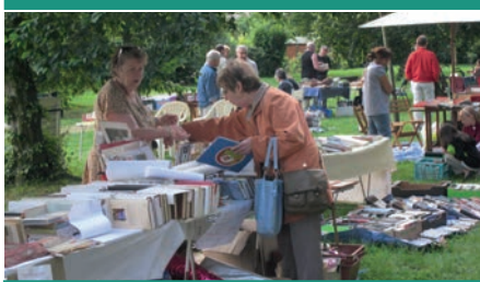
Foire aux livres.