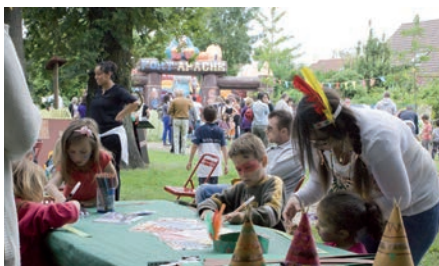
Fête de l'enfance et de la jeunesse.