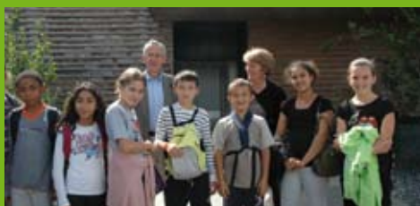
La Plaine de France met la piscine à disposition de toutes les écoles du canton

Le service de transport scolaire, assuré par Viabus, ainsi que l'activité sont totalement pris en charge par les communes, qui bénéficient toutes du même tarif. La priorité est donc donnée aux scolaires, qui, jusqu'à présent, faute d'équipement avaient dû renoncer à la natation ou supporter de longs déplacements.