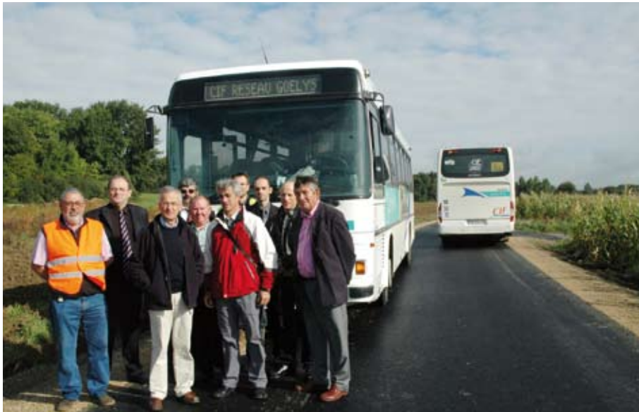
Mi-septembre, les élus et les responsables des CIF ont validé le premier croisement de bus sur la chaussée restaurée.

Toujours dans un souci d'intérêt général, cette action intercommunautaire, financée par la Plaine de France , bénéficie ainsi à tout le secteur.