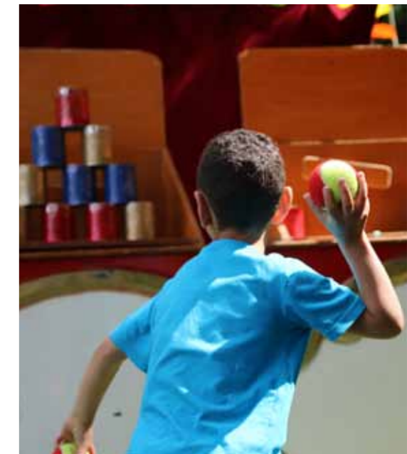
Othis en fête, 25 juin