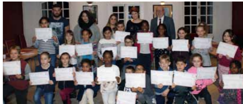
Installation du Conseil municipal enfants, 6 décembre