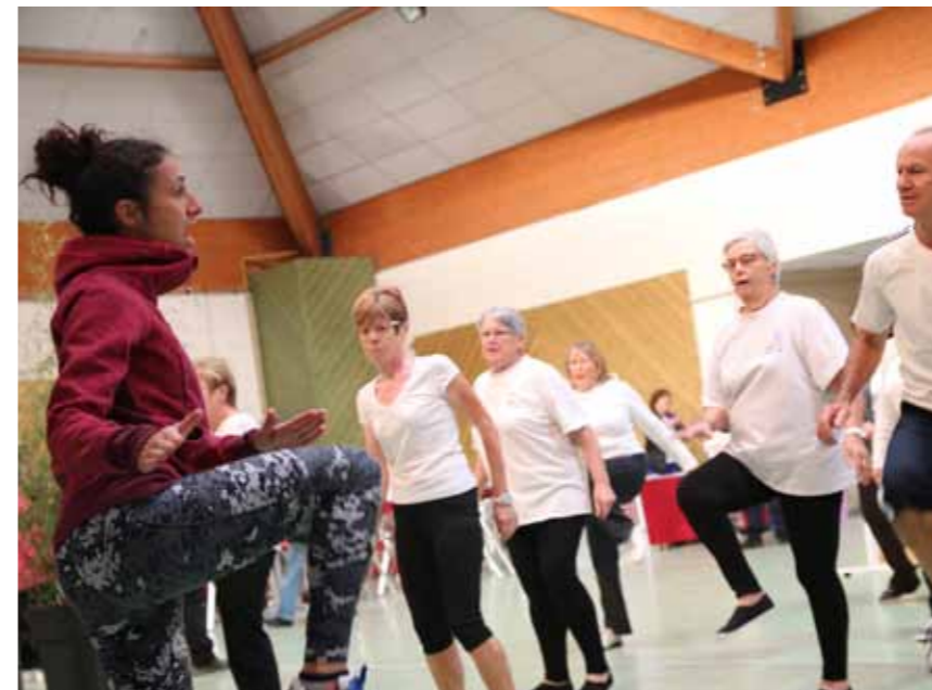
Salon des seniors, du 6 au 9 octobre