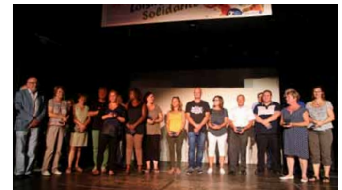
Podiums, 2 septembre