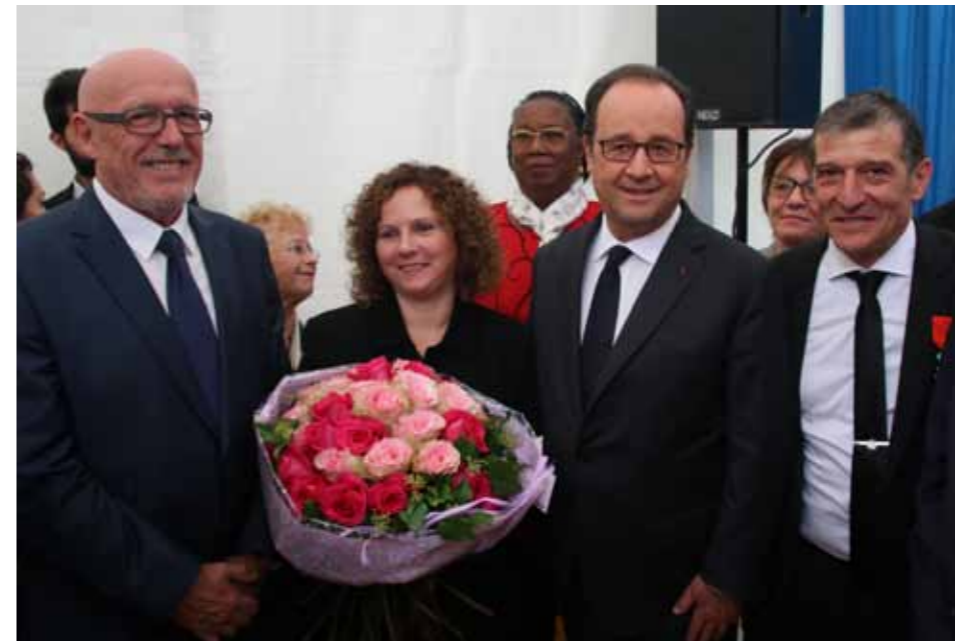
Inauguration des locaux de l'entreprise CTD, 29 septembre