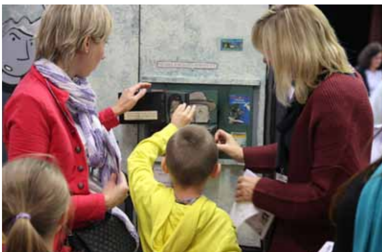
Fête des mots, 29, 30 septembre et 1 er octobre