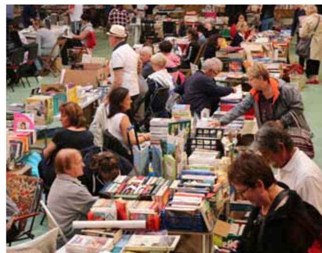
Foire aux livres, 18 septembre