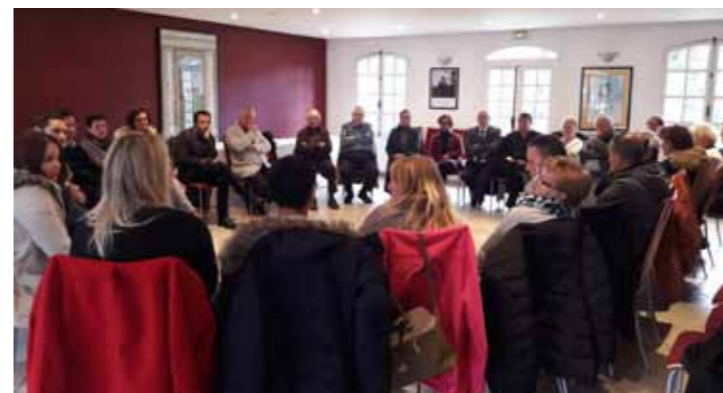
Accueil des nouveaux habitants, 19 novembre