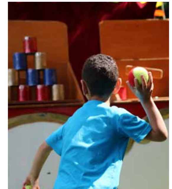
Othis en fête, 25 juin