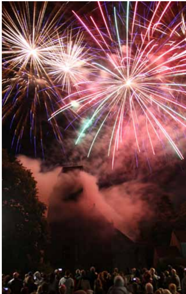
Fête nationale, 13 juillet