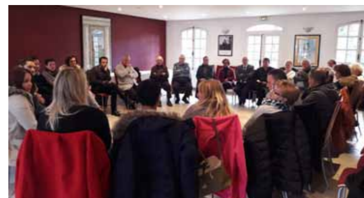
Accueil des nouveaux habitants, 19 novembre