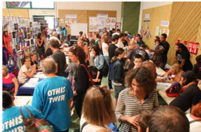
Forum des associations, 3 septembre