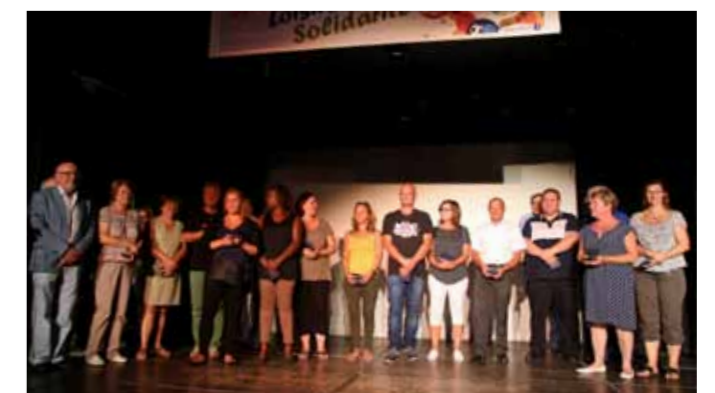
Podiums, 2 septembre