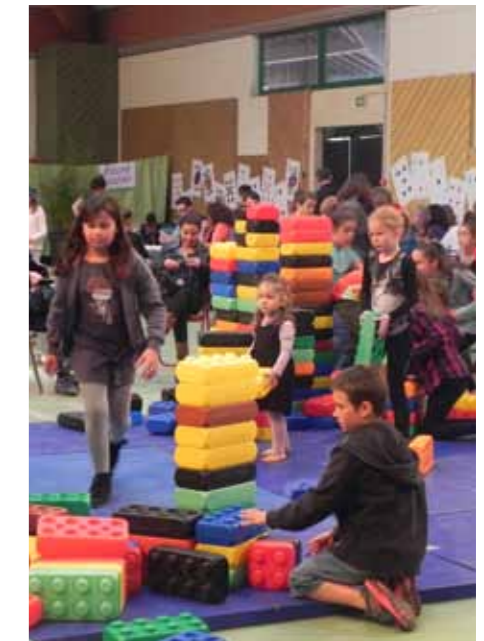
Grande récré, 8 octobre