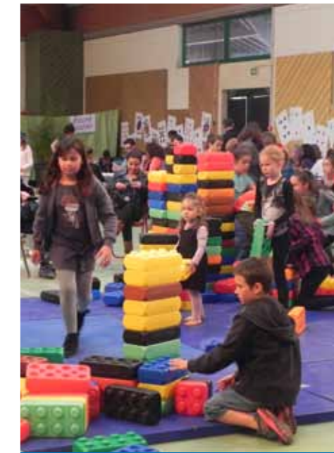
Grande récré, 8 octobre