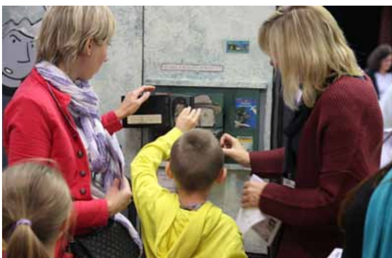
Fête des mots, 29, 30 septembre et 1 er octobre