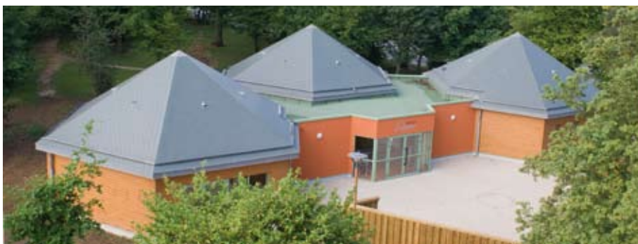
La nouvelle maison des jeunes, baptisée Espace Balavoine, d'une surface de 290 m 2 , se compose de trois ensembles reliés par un hall d'accueil, de terrasses et d'un amphithéâtre en bois.

Toujours apprécié par la jeunesse, pour ses chansons, ses engagements et ses valeurs, Daniel Balavoine a naturellement été choisi pour prêter son nom. Sa sœur très émue, a conclu en saluant l'ensemble des actions des élus : « Nous avons ici des personnes qui mettent en place et sur pied ce qui est nécessaire pour que la vie naisse et continue de la plus belle des manières ».