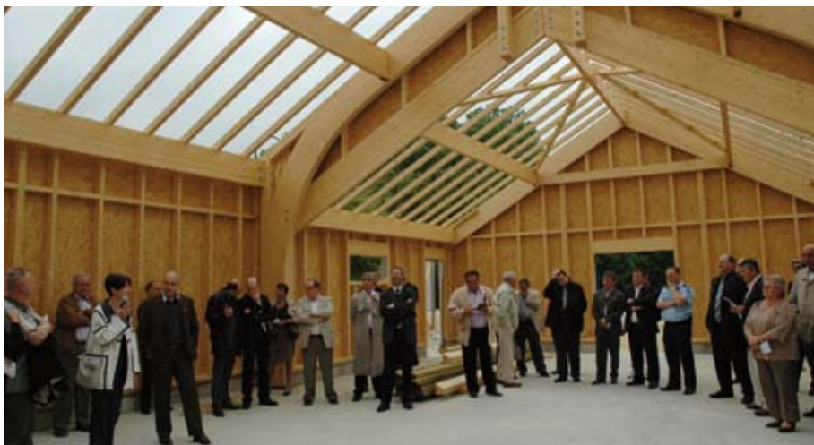
Le chantier de la salle polyvalente de Nantouillet

10h Visite du gymnase de Juilly qui, lui aussi, a déjà pris forme. La structure, la charpente, la couverture ainsi que la tribune extérieure ont pris place et "l'aménagement intérieur va bientôt commencer", précise l'architecte, M. Carrère. Et d'ajouter que cet équipement "éco-citoyen" d'une surface de 840 m 2 pourra accueillir "tous les sports et même le hand ball". Dix-huit mois de travaux est un délai court pour un bâtiment de cette taille. Il devrait ouvrir ses portes au public en juin 2011.