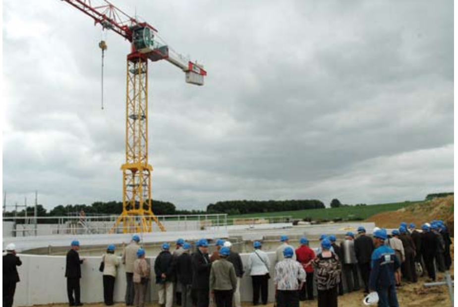
Les bassins de la station recevront les effluents à la fin de l'année 2010

12h45 Enfin, le bus se dirige au complexe Plaine Oxygène, l'étape d'arrivée du tour. M. Haquin accompagne M. Cazenave-Lacrouts, Sous-préfet de Meaux, pour la visite du complexe de loisirs, dont les travaux d'achèvement sont en cours.