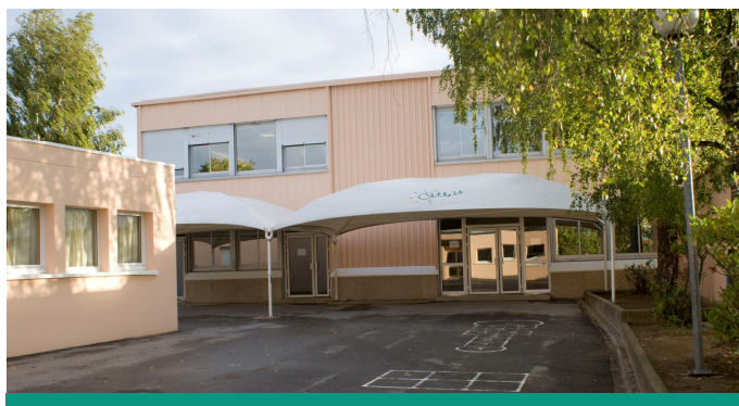
Le toit de l'école primaire de Guincourt sera réhabilité

• Création de deux passages piétons aux normes PMR (Personnes à Mobilité Réduite) et reprise d'un cheminement piétonnier : deux nouveaux passages piétons seront dessinés à l'intersection de la rue des Châtaigniers et de la rue Charlemont, et à l'intersection de la rue des Châtaigniers et de la rue du Saut de la Pierre. Par ailleurs, le chemin piétonnier situé entre le centre commercial La Jalaise et l'entrée de ville sera rénové.