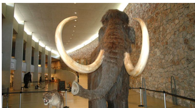
Les élèves de Beauré visiteront le musée de la Préhistoire