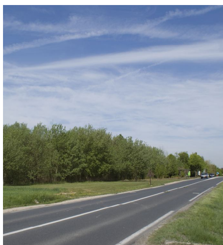
La salle des sports sera construite à l'entrée de ville côté Jalaise

Propriété de la commune, le champ de six hectares, situé à l'entrée de ville côté Jalaise, a vu depuis 15 ans un petit bois sortir naturellement de terre. Aujourd'hui, ce bois est en partie élagué et défriché pour accueillir une future salle des sports. Ce nouvel équipement, souhaité par les sportifs othissois, sera mis à la disposition des écoles et des associations afin d'accueillir et d'étendre des activités qui ont lieu notamment à l'Agora. La construction débutera au second semestre 2012.