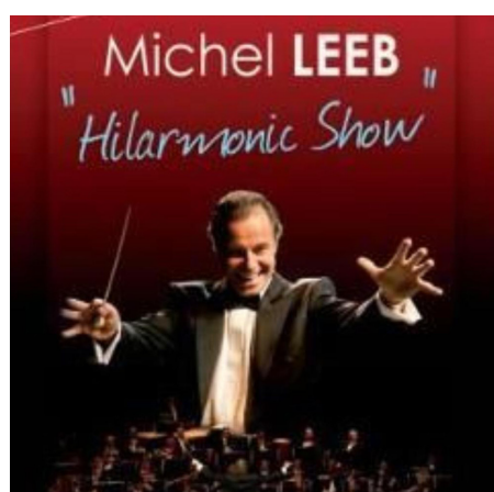
Un des prochains spectacles

Suite à l'arrêt brutal de l'animation CielEcran décidé par la société Pathé Live et devant le succès que rencontrait cette manifestation à chaque diffusion, la commune a souhaité proposer une offre similaire à ses administrés.